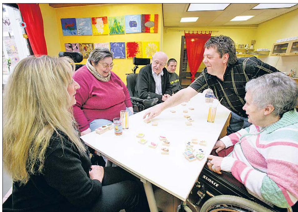
Zu der Beschäftigungstherapie der behinderten Menschen zählen ebenso knifflige Spiele.

Sonntag, den 29. März: Osterbasar im Foyer (15 bis 19 Uhr); Von Samstag, dem 4. April, bis Sonntag, dem 12. April: Ausstellung „Kunst kennt keine Grenzen“ im Dalheimer Gemeindehaus (14 bis 18 Uhr); Sonntag, den 20. September: Sommerfest im Foyer (11 bis 19 Uhr).