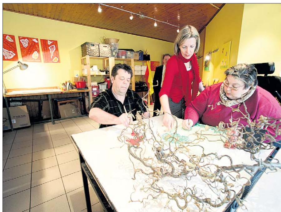
In den verschiedenen Ateliers im Foyer wird die Kreativität gefördert.

40 Jahre Fondation Adiph und 30 Jahre Foyer La Cerisaie in Dalheim