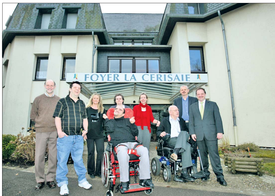
Zufriedene Gesichter: Direktion und Personal legen Wert auf das Wohl der Bewohner.